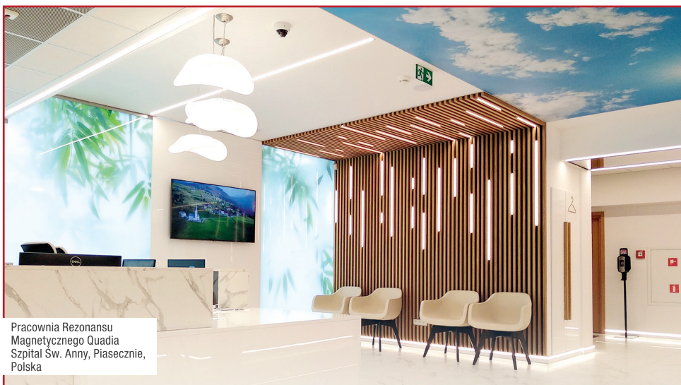
Pracownia Rezonansu Magnetycznego Quadia Szpital Sw. Anny, Piasecznie, Polska