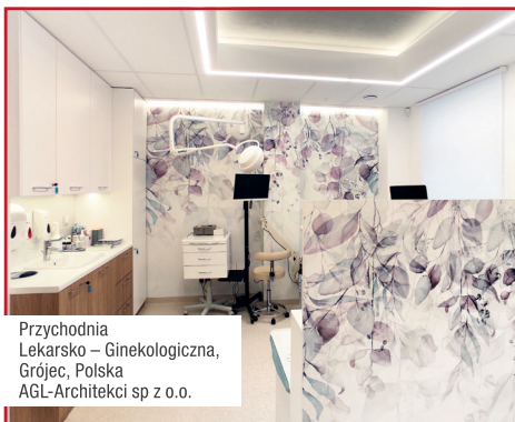
Przychodnia Lekarsko – Ginekologiczna, Grójec, Polska AGL-Architekci sp z o.o.