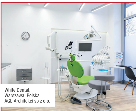
White Dental, Warszawa, Polska AGL-Architekci sp z o.o.